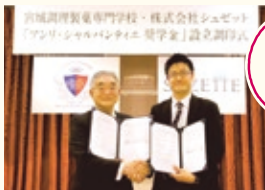
創設に伴う調印式の様子 (左:宮城調理製菓専門学校、右:株式会社シュゼット)

パティシエを目指す若者の夢を応援したいという想いから、2015年4月より、宮城調理製菓専門学校上級製菓技術科・製菓衛生師科へ入学する学生を対象に、東日本大震災で被災した学生をサポートしています。初年度にサポートした学生が2017年春に巣立ち、さらに制度の充実・新しい支援活動がスタートします。